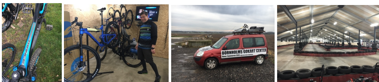
Foto: 2 ret så forskellige projekteksempler fra outdoor- og oplevelsesøkonomien: Trailcenter Bornholm og Bornholms Gocart Center. Stadigt flere aktivitetstilbud ser dagens lys – og de er meget alsidige!

Mht. kapaciteter og kompetencer, så sker udviklingen på øen i det bedste samspil med andre nøgleaktører. BusinessCenter Bornholms Iværksætterinitiativ - det socialfondsstøttede projekt "588" - leder direkte ind til mulighederne for at søge etableringstilskud under LAG-ordningen. Destination Bornholms outdoor-klynge understøtter de forskellige LAG-støttede outdoor-projekter, og Fødevarerklyngens og Madkulturhusets mange netværksaktiviteter virker helt tydeligt også som en rugekasse for nye projekter.