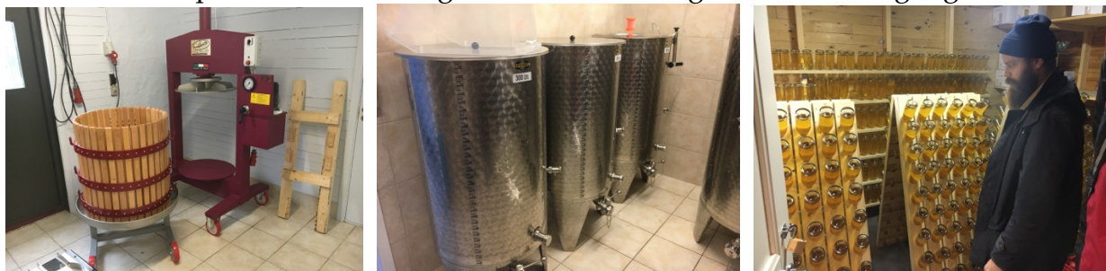
Ny nicheproduktion – materialer og udstyr indkøbt med tilskud fra LAG-Bornholm