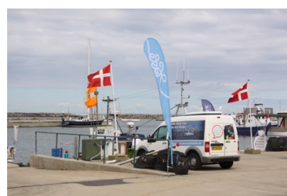
Foto: 3 maritime projekter. Fællesskabshus på Kampeløkken Havn, Bornholm som kajakdestination i Sandvig og Frisk fisk fra kutter – Hasle Havn.

Siden programstart er der gennemført rigtig mange ganske innovative projekter. Innovation er som bekendt en relativ størrelse. Skal vi fremhæve nogle af de mest innovative inden for LAG-Bornholm, kunne det være etablering af en produktion af skræddersyede kasketter i regi af firmaet Wilgarts, diverse nye sundhedsdrikke i form af Nordisk Kambucha, Vandkefirperler, hampe-te, mm. Indenfor outdoor-temaet tænker vi også, at nogle af de projekter som Eastwind har gennemført – med f.eks. at samle outdoor-aktiviteter og tilbud på en fælles web-portal og samtidig opbygge et netværk blandt udbyderne – er rimelig innovativt. Vil også nævne, at LAG-Bornholms mangeårige og vedholdende satsning og opbakning til kunsthåndværket har betydet, at øen i 2017 som